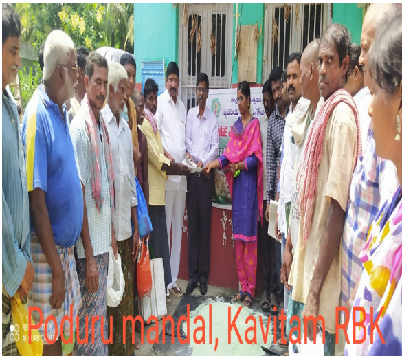
Poduru mandal, Kavitam RBK