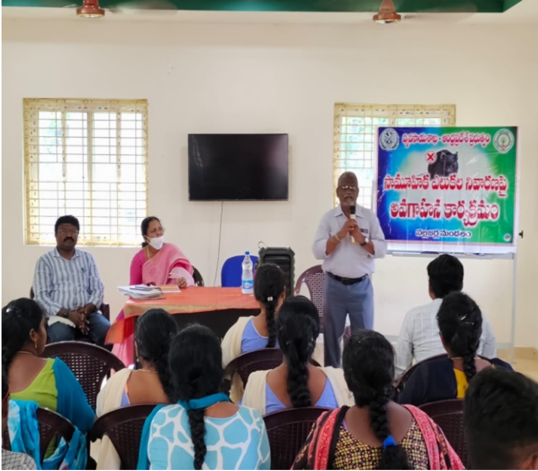
DISTRICT LEVEL RCC-KHARIF 2022 Trainings at Mandal Level: By DDA, DRC,EGDt

ರైತು ಭರಾಸಾ ಕೆಂದ್ರ ಸ್ಥಾಯಿಲೊ ಜಿಕ್ಷಣ ಕಾರ್ಯಕ್ರಮಮುಲು