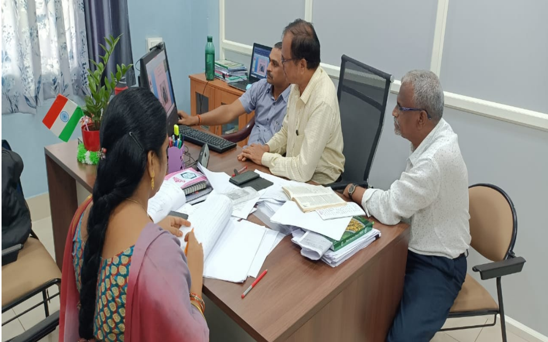
VIRTUAL TRAINING E.G.DT, RAJAMAHENDRAVARAM