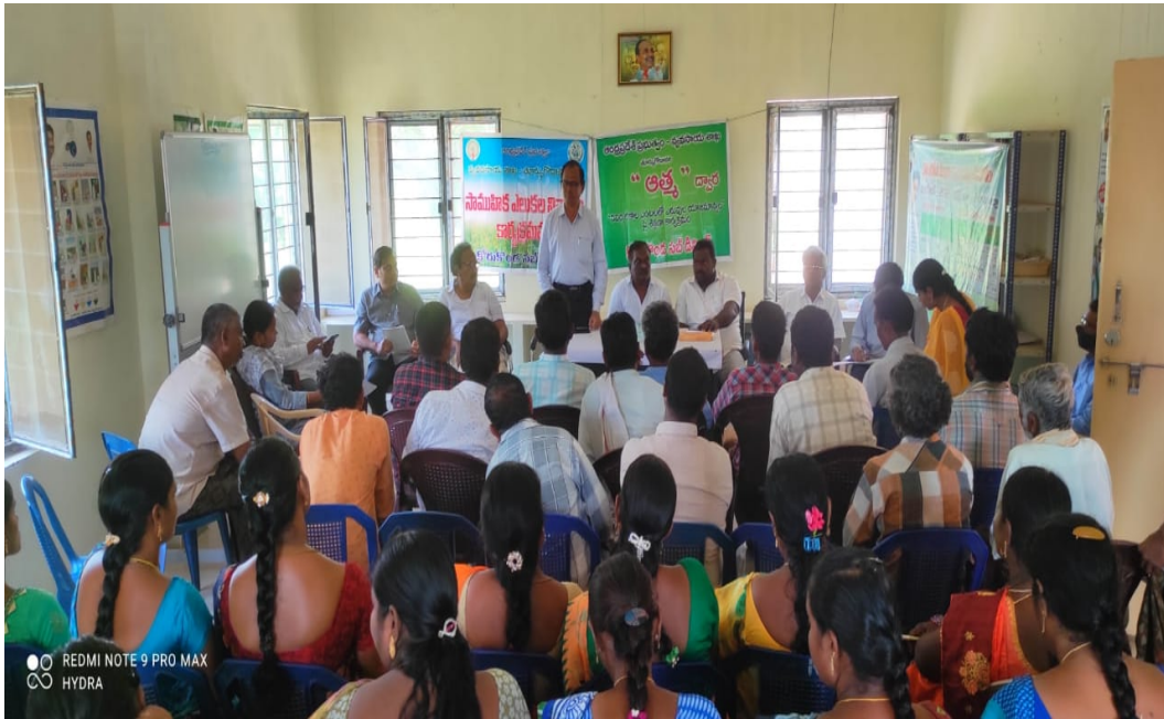
Trainings to farmers at RBK level:Participation of DAO,DD DRC, DAATTC Scientist & PD, ATMA, Kakinada

ರైತು ಭರಾಸಾ ಕೆಂದ್ರ ಸ್ಥಾಯಿಲೊ ಜಿಕ್ಷಣ ಕಾರ್ಯಕ್ರಮಮುಲು