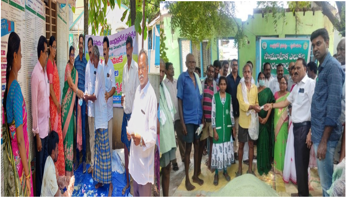
By Smt. G.Suneetha DDA (Seeds)